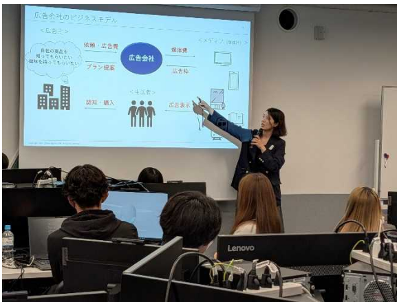
オリエンテーションで学生にテーマの説明をする当社社員

※DOOH：Digital Out of Home の略称。街頭や駅などの公共空間に設置されたデジタルサイネージを活用した広告メディアのこと。